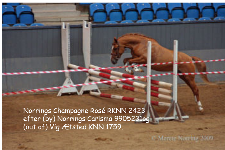
Norrings Champagne Rosé RKNN 2423 efter (by) Norrings Carisma 9905231og (out of) Vig Ætsted KNN 1759.

I don't want to judge the judges and the arrangement – the photos are telling about the day and so are the results in the schedule.